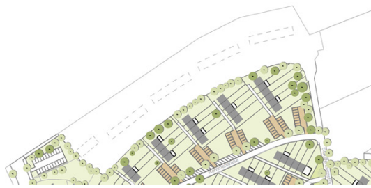
Planausschnitt Szenario 4c (2016)