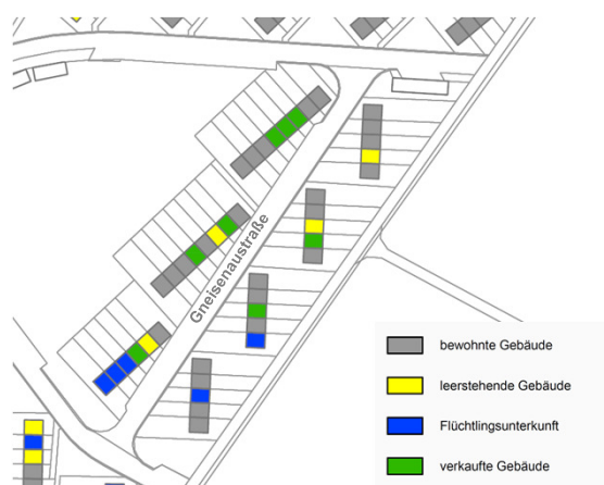
Leerstände / Verkäufe im Bereich Gneisenastraße Stand Oktober 2017