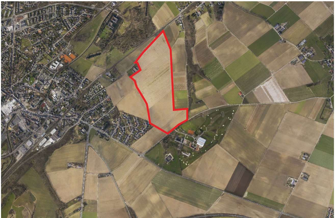
Abbildung 1: Luftbild des Plangebietes