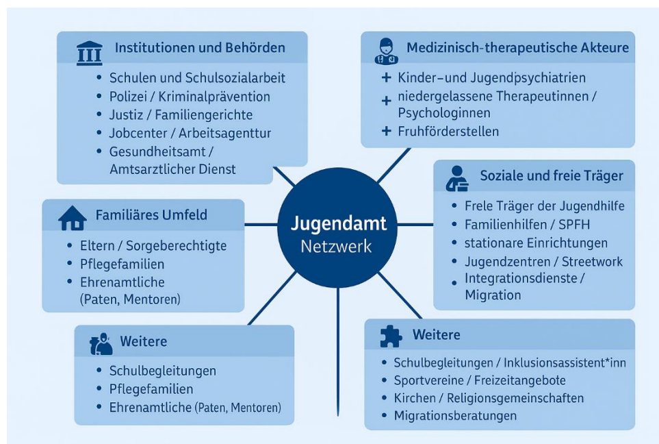
Abbildung 5: Jugendamt Netzwerke – Eigene Darstellung

In diesen Netzwerken arbeiten Fachkräfte aus unterschiedlichen Professionen zusammen – z. B. aus Jugendhilfe, Gesundheitssystem, Justiz, Bildungseinrichtungen, Polizei, Beratungsstellen und freien Trägern. Da Kinderschutz eine vielschichtige Aufgabe ist, kann kein Akteur allein den komplexen Anforderungen gerecht werden. Eine vernetzte Zusammenarbeit ist daher unerlässlich.