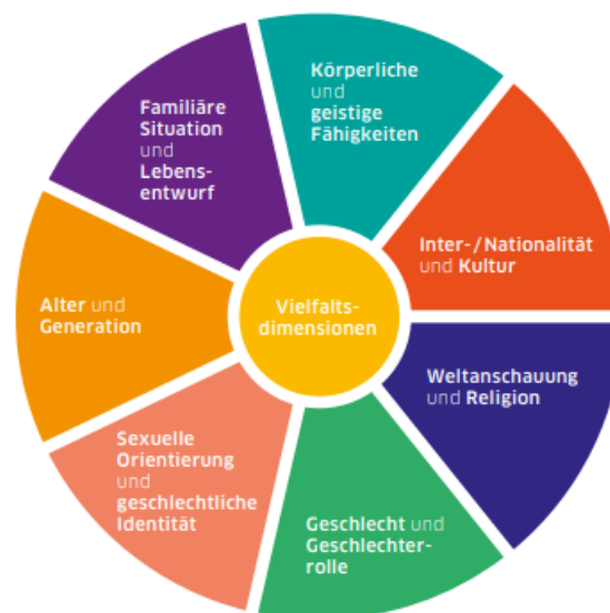
Abbildung 3 Vielfaltsdimensionen

In diesem Kontext bedeutet Pluralisierung , dass Menschen in zunehmendem Maße die Freiheit haben, ein von ihnen bevorzugtes Lebensmodell zu wählen. Gleichzeitig sind jedoch auch Faktoren wie Krieg, Armut und Zuwanderung prägende Elemente einer Gesellschaft, deren Ausdifferenzierung nicht immer auf einer selbstbestimmten Wahl basiert, sondern teils durch äußere, oft schwierige Lebensumstände bedingt ist.